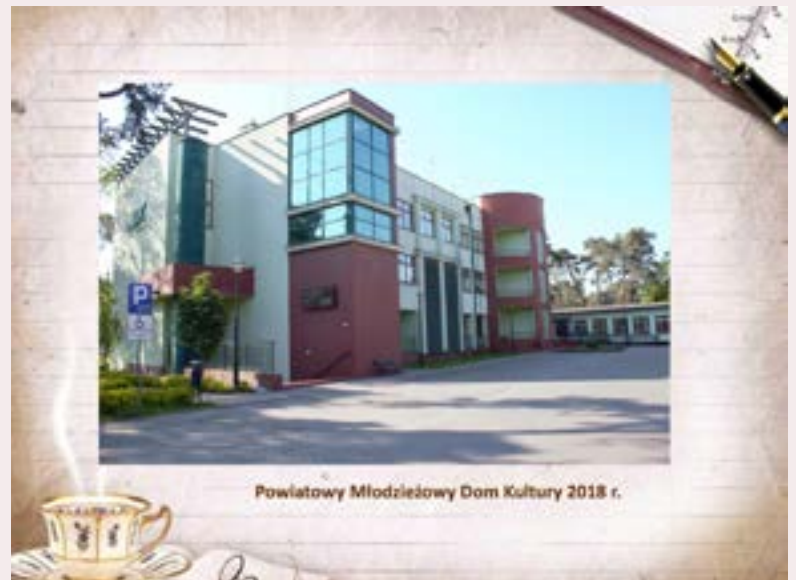
Powiatowy Młodzieżowy Dom Kultury 2018 r.