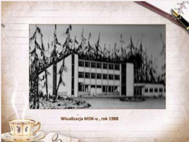
Wizualizacja MDK-u , rok 1988